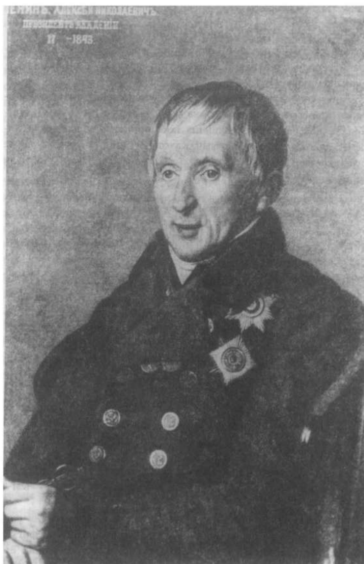
Рис. 1. Алексей Николаевич Оленин (Портрет работы А. Г. Варнека)