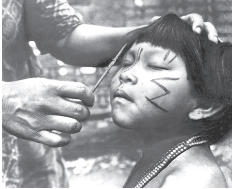
Рис. 1.1. Детство – особый период в жизни представителя традиционного общества. Человека предстояло «доделать».

Здесь знания о темпах биологического развития послужили основой для возникновения ритуала.