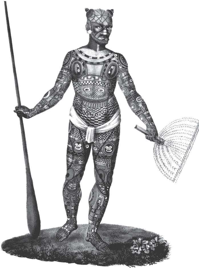
Рис. 1.2. Воин с Маркизских островов, XIX век.

ментов. В Японии, Новой Зеландии, на островах Пелау или на Формозе, на Маркизских островах узоры татуировки покрывали значительную часть поверхности тела, образуя живописный покров. (Рис. 1.2)