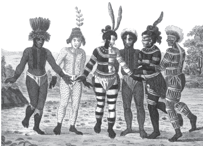
Рис. 1.4. Спутник адмирала Крузенштерна Вильгельм фон Тиленау запечатлел калифорнийских индейцев в ритуальной раскраске (1806 г.).

Татуировка казалась характерной традицией «первобытных» народов, живших к моменту их знакомства с европейскими путешес-